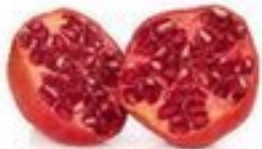
der Granatapfel (-äpfel)