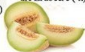
die Melone (-n)