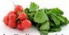
das Radieschen (=)