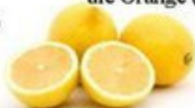
die Zitrone (-n)