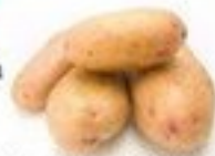
die Kartoffel (-n)