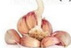
der Knoblauch (-e)