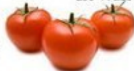
die Tomate (-n)