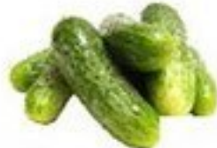
die Gurke (-n)