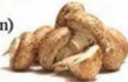
der Pilz (-e)