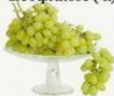
die Weintraube (-n)