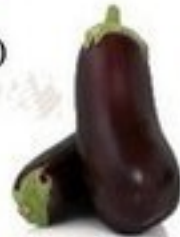
die Aubergine (-n)