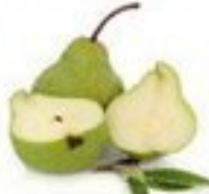
die Birne (-n)