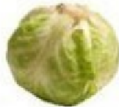
der Kohl (-e)