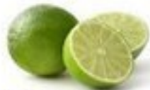
die Limette (-n)