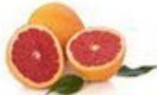
der Grapefruit (-s)