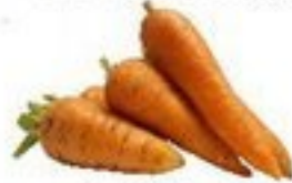
die Möhre (-n)