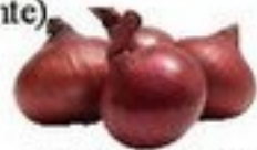
die Zwiebel (-n)