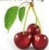
die Kirsche (-n)