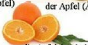
die Apfelsine (-n) / die Orange (-n)