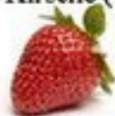
die Erdbeere (-n)